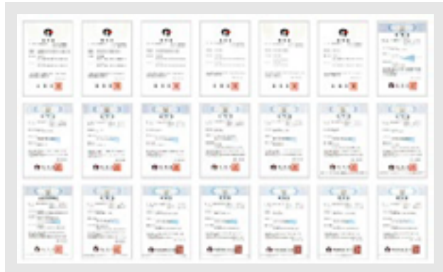
特許及び認証 2013年販売開始から世界へ8000台以上の出荷実績。